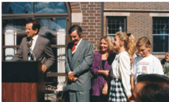
Guverner Perpich i Borisova obitelj u guvernerovoj palači u St. Paulu 1990.