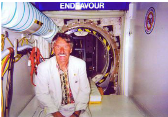
NASA - antikoroziivna rješenja u Space Shuttle programu.