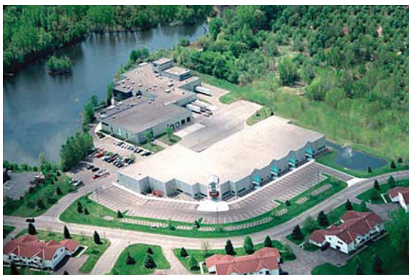
Sjedište Cortec Corporation, St. Paul, Minnesota 2001.