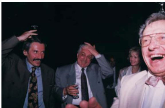
Na rođendanu Predsjednika Tuđmana, 1993.