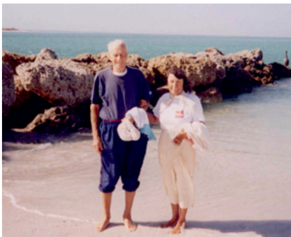
Moji roditelji, u šetnji plažom Longboat Key.