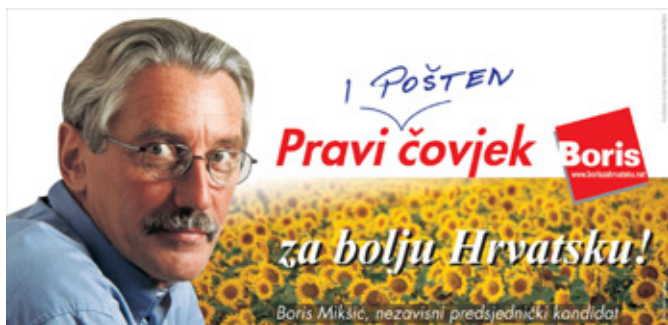
Borisov jumbo plakat s predsjedničkih izbora 2005.