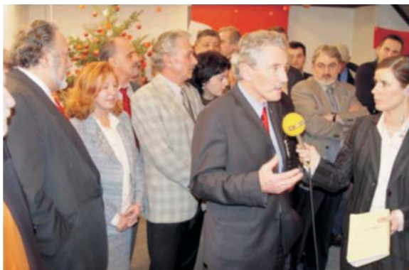
Tijekom izborne noći u Ulici kneza Mislava, nakon famozne objave Državnog izbornog povjerenstva da su Mesić i Kosor prošli u drugi izborni krug, Zagreb, 2005.