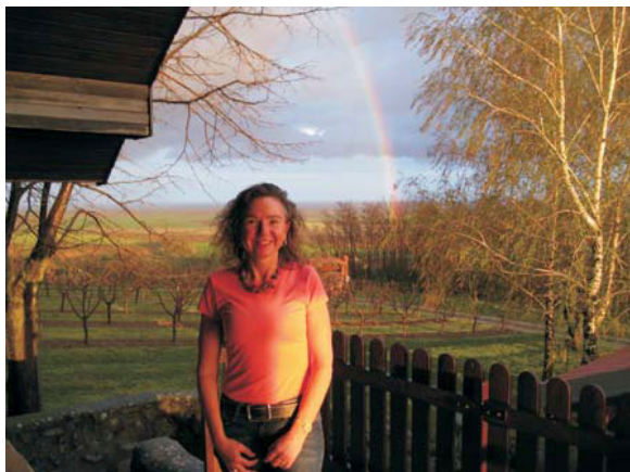
"Duga" i duga s našim breskvama u pozadini.