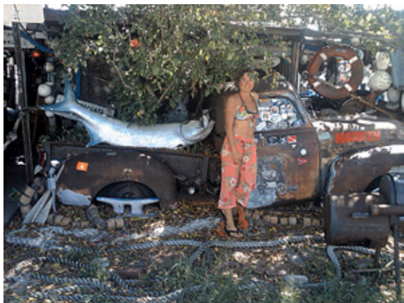
Postoje tri neizbježne životne činjenice: smrt, porez i korozija. Hvala ti Bože na koroziji!