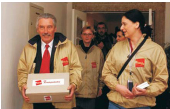
Predaja 10000 potpisa potrebnih za predsjedničku kandidaturu, Zagreb, 2004.