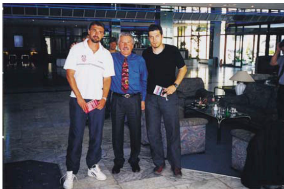
S Goranom Ivaniševićem i Slavenom Bilićem u Splitu dva tjedna prije Goranovog trijumfa u Wimbledonu.