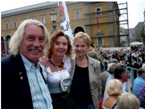
S Barbarom, spremni za feštu na Oktoberfest-u u Minhenu.