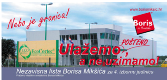
Borisov jumbo plakat s parlamentarnih izbora 2007.