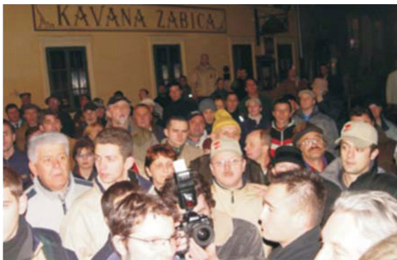
Prosvjed nezadovoljnih glasača nakon izborne prijave u predsjedničkoj kampanji, Zagreb, 2005.