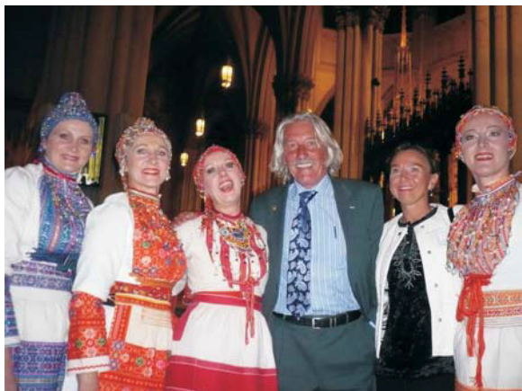
S nacionalnim folklornim ansamblom "Lado", u katedrali Sv. Patricka, New York