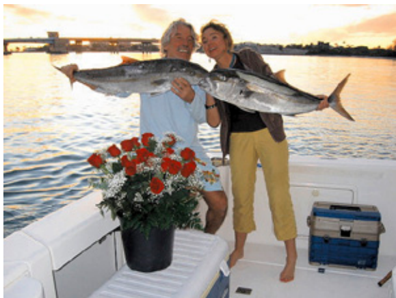
Sretni mladenci i njihovi gofovi za sreću.