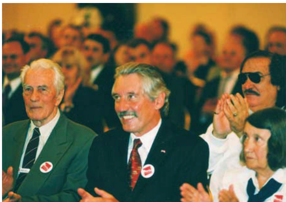
S Mišom Kovačem na izbore, 2004.