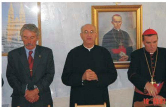
S kardinalom Bozanićem za vrijeme blagoslova crkve Hrvatskih mučenika, Hrnetić, 2004.