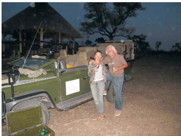
Safari u Sabi Sabi, Južna Afrika.