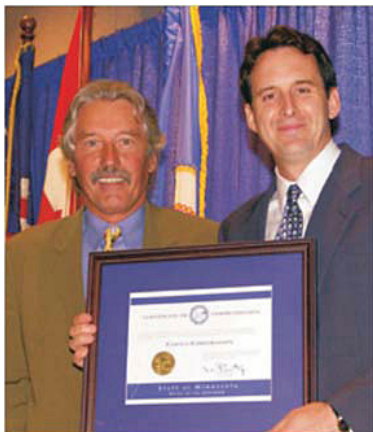
Guverner Minnesote Tim Pawlenty uručuje priznanje Borisu Mikšiću najuspješnijem izvozniku godine u Minnesoti 2003.