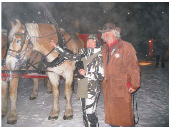
Poslije skijanja, planinski stil Colorada.