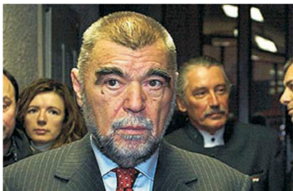
Nakon suđenja na kojem je predsjednik RH Stjepan Mesić tužio zbog klevete građanina Borisa Mikšića. Pravosudna farsa završila je u rekordnih 2 sata. Samobor, 2006.