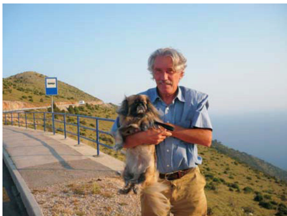
Munchkin "uživa" na otoku Cresu.