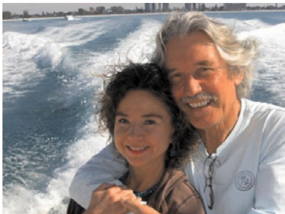
"Saga" nas nosi prema međunarodnim vodama Meksičkog zaljeva.