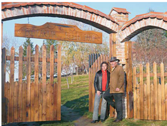
Naš hrvatski san, "Peachill Eko Farma".