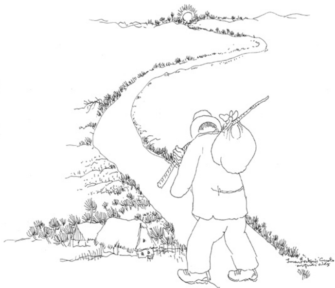
Ivan Lacković Croata, “S pinklecom u tuđinu”, jedan od zadnjih autorovih crteža, 2004.