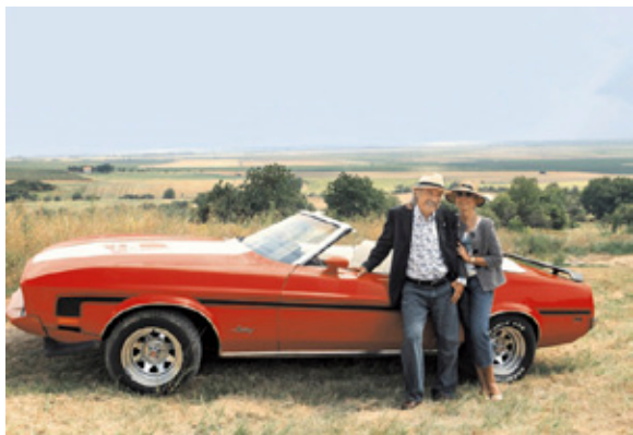
U Belom Manastiru, s našim Mustangom iz 1973, Mach I